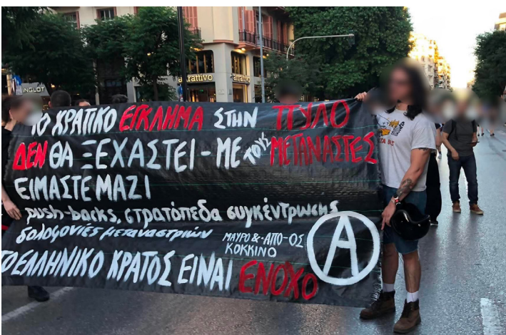
Από την πορεία για το κρατικό έγκλημα στην Πύλο, 14 Ιούνη 2026, Θεσσαλονίκη

Συλλογικότητα για τον Κοινωνικό Αναρχισμό- Μαύρο & Κόκκινο μέλος της Αναρχικής Πολιτικής Οργάνωσης